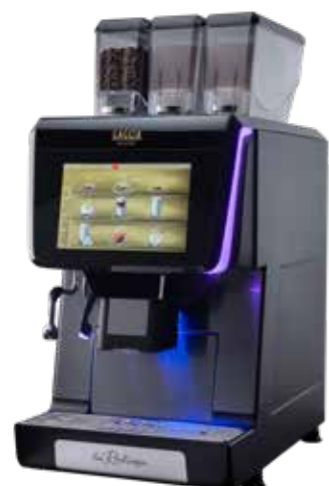
LA RADIOSA ES+2IN+EVOMILK