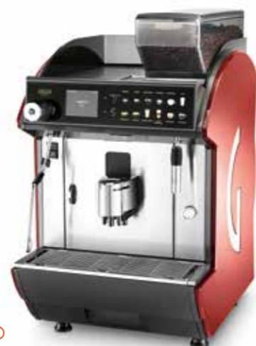
CONCETTO EVO CAPPUCCINO