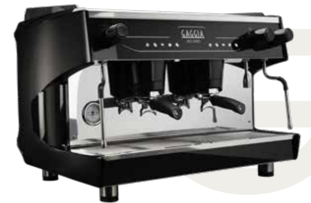
LA DECISA 2 GRUPPI