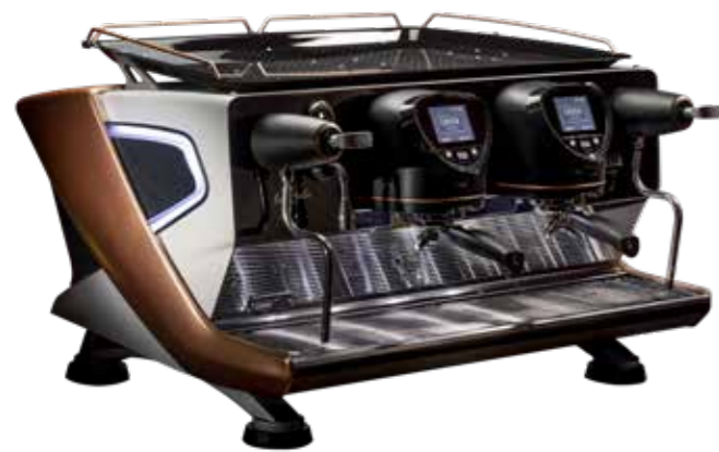
LA REALE 2 GRUPPI / LA REALE 2 GRUPPI DFC